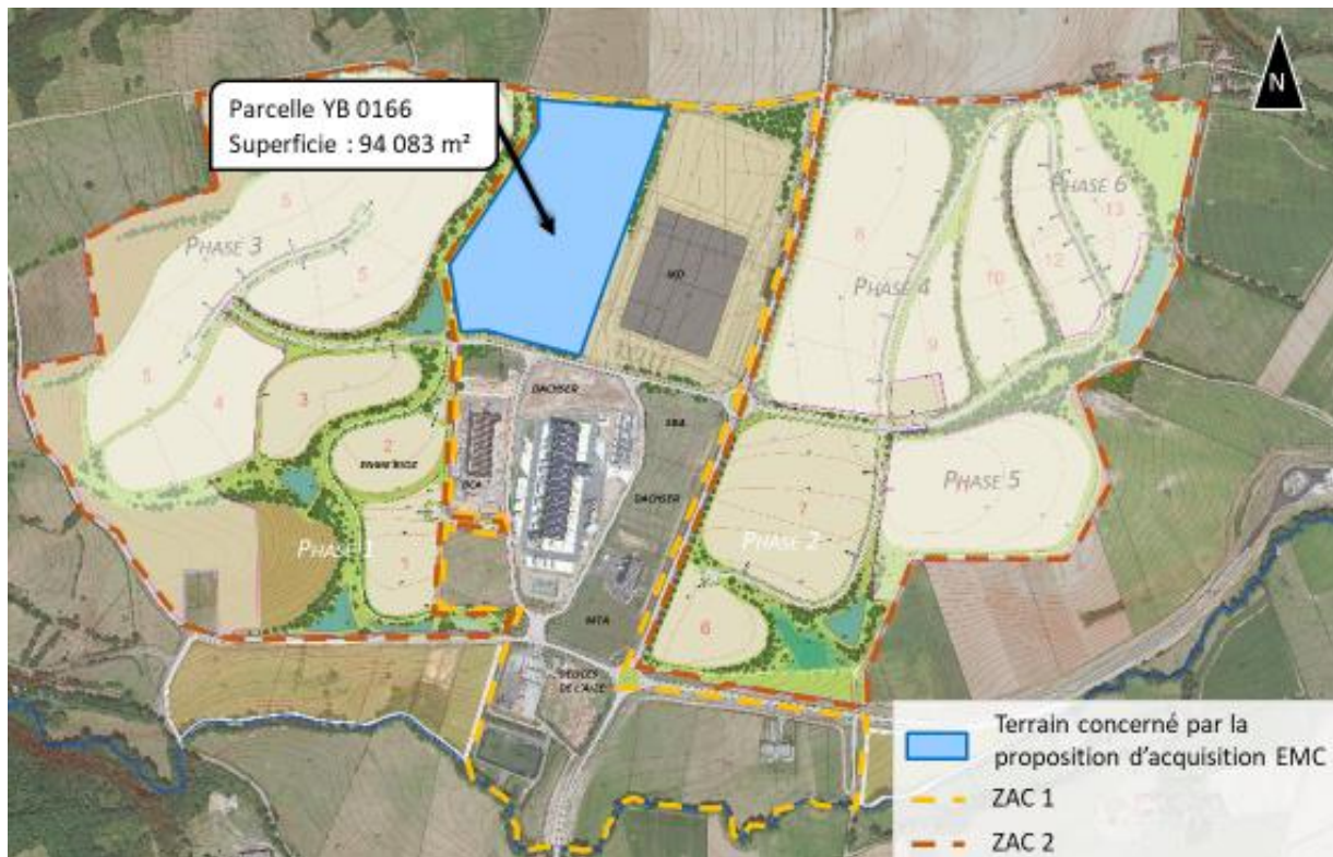
Terrain concerné par la proposition d'acquisition de EMC

Oui cet exposé et après en avoir délibéré, le conseil communautaire, à l'unanimité :