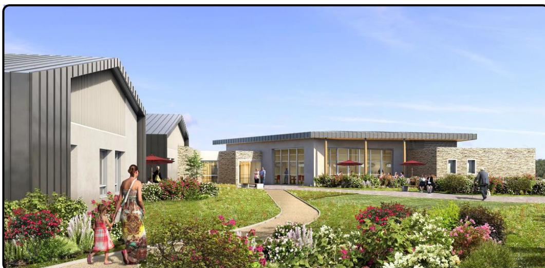
Perspectives extérieures du bâtiment

Le Permis de Construire a été validé par arrêté du 25/06/2019.